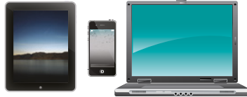
Direktes Scannen an PC/ mobile Geräte