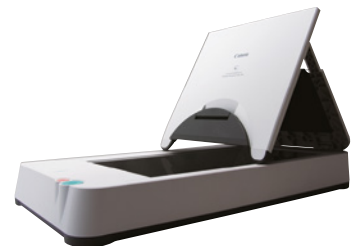
DIN A3-Flachbett-Scaneinheit 201