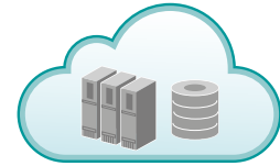
Freigabe für Cloud- Arbeitsabläufe